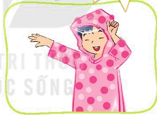
Tự mặc áo mưa