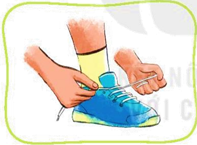
Tự buộc dây giày